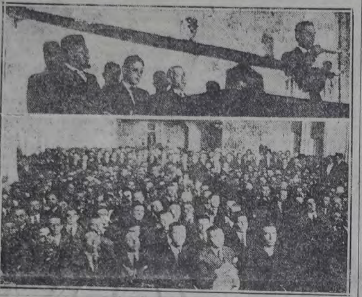
DOS INTERESANTES NOTAS DEL MITIN DE AYER EN LA CASA DEL PUEBLO.

Dijo luego que hace unos días leyó un suelto cuyo título "El pueblo chino contra el mundo" le hizo gracia, preguntándose entonces si el pueblo chino compuesto por cuatrocientos treinta millones de hombres, que tiene como